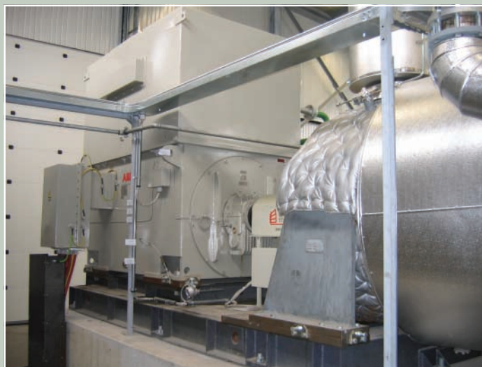
Deze ORC van 2,5 MWe wordt gevoed via overschotten op het warmtenetwerk (180°C) van de afvalverbrandingsoven te Roeselare.

Afvalverwerker MIROM Roeselare verbrandt jaarlijks 62.000 ton huisvuil en voedt hiermee het stedelijk verwarmingsnetwerk. De warmtevraag is echter niet constant zodat er, vooral tijdens de zomer, overschotten op het warmtenetwerk ontstaan. Om deze hoeveelheden warm water van 180°C te valoriseren, installeerde MIROM recent een ORC-installatie die een vermogen tot 3 MWe kan leveren. Dat is voldoende om 5.000 gezinnen van elektriciteit te voorzien.